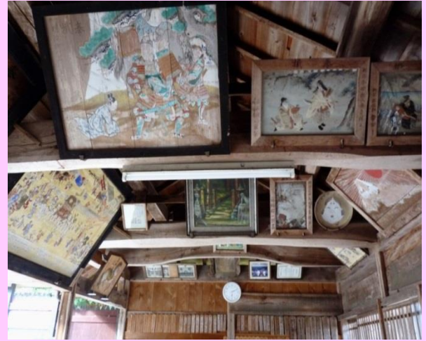
近内御霊神社 絵馬堂